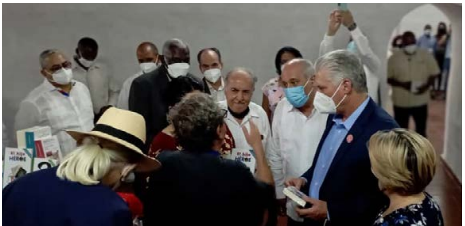
El presidente cubano recorrió el Pabellón de México e intercambió con escritores y otras personalidades, entre ellos Paco Ignacio Taibo II.

Habló también de la solidaridad, de cómo Cuba envió médicos a México en el momento más crítico de la pandemia. “Hace unas semanas un buque repleto de cultura zarpó del puerto de Veracruz”, dijo Frausto, y recordó cómo el Huasteco transportó más de 25 000 “libros y esperanza a esta nación.”